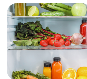
Conservation des aliments