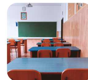
Salles de classe